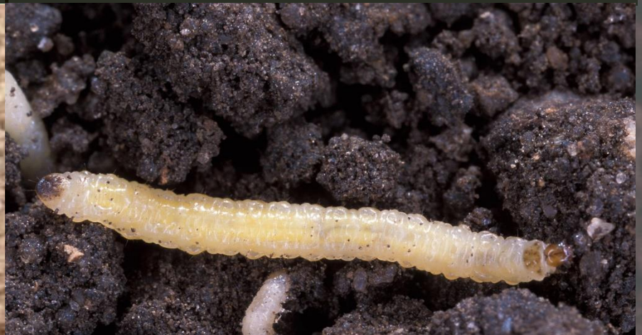
Diabrotica spp. (Larva)