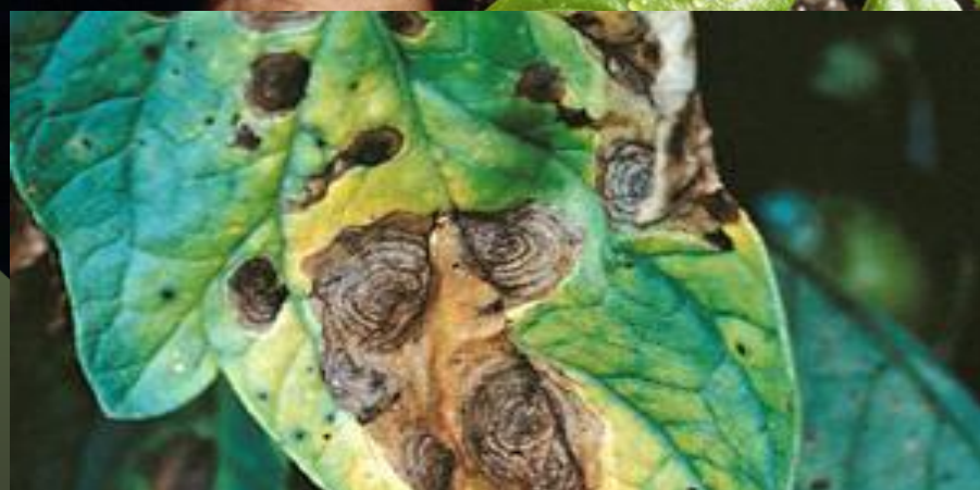
Tizón Temprano (Alternaria solani)