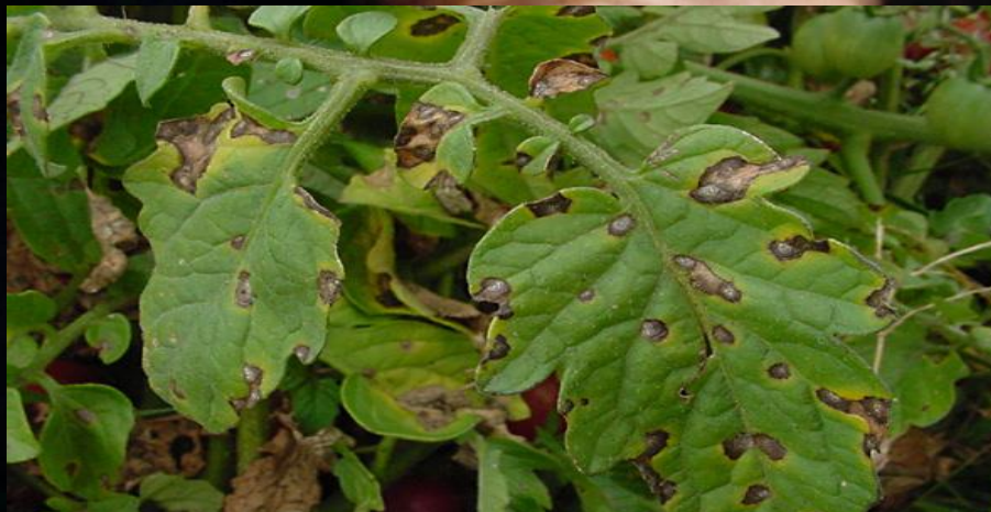
Viruela (Septoria spp.)