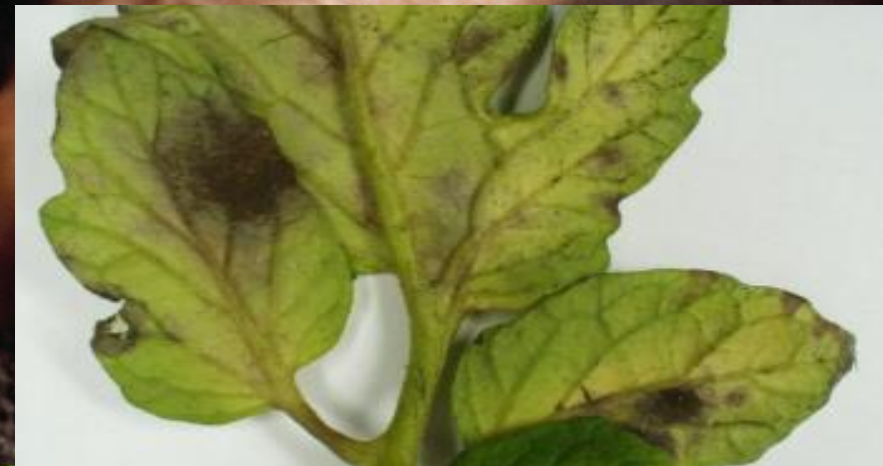
Mancha Foliar (Cladosporium fulvum)